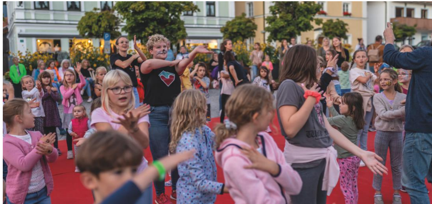
Regelmäßig mittwochs wird auf dem Bodenmaiser Marktplatz eine fetzige Kinderdisco gefeiert!

Ab Juli geht's wieder rund mit unserem Kinder- und Familienprogramm : Freut euch auf einen Familienausflug in den Nationalpark Bayerischer Wald, Goldwaschen im „Urwald“ oder fetzige Kinderdiscos auf dem Marktplatz und eine Zaubershow mit Zauberer Waltini