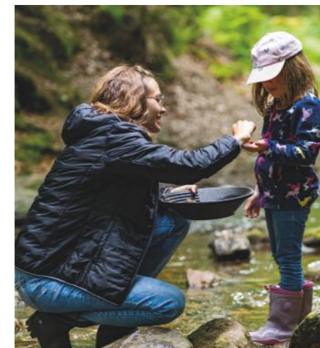
Goldwaschen im „Urwald“.

Montag, 22. Juli, 16.30 Uhr: „Indian Balance“ für Familien: Mit indianischer Musik, Rhythmen, Klängen und Trommeln erleben Kinder mit ihren Eltern Entspannungsmomente. Mit tierischen Bewegungsbildern und Freude am gemeinsamen Üben stärken wir das Selbstbewusstsein, Achtsamkeit und die Konzentration. Dauer ca. 45 Minuten. Indoor im Vitalzentrum, outdoor im